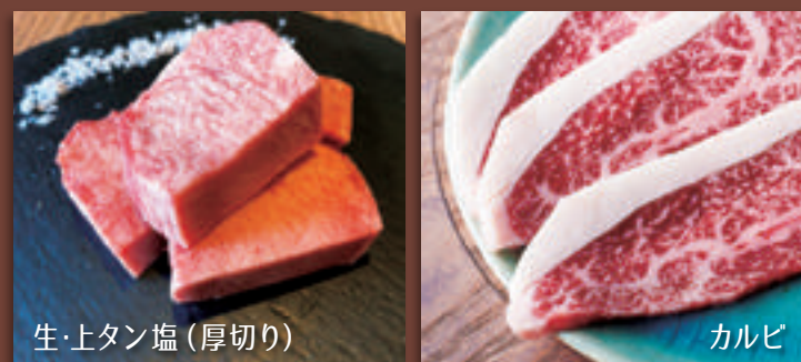
生・上タン塩 (厚切り)