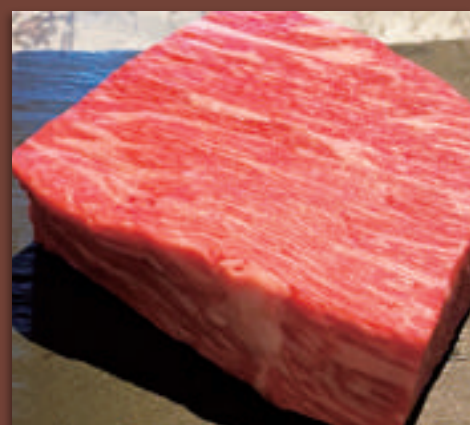
赤身ステーキ ※写真は200gです。