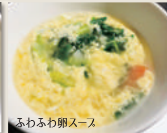
ふわふわ卵スープ

ふわふわ卵スープ —— ¥500 わかめスープ —— ¥500 コムタンスープ —— ¥950 テグタンスープ —— ¥800