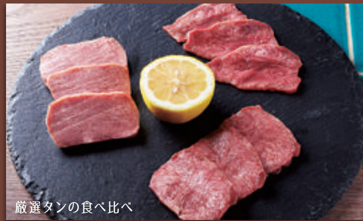
厳選タンの食べ比べ